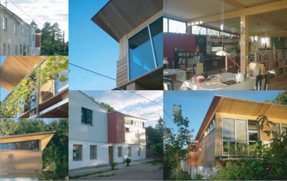
UMBAU UND AUFSTOCKUNG EINES WOHNHAUSES