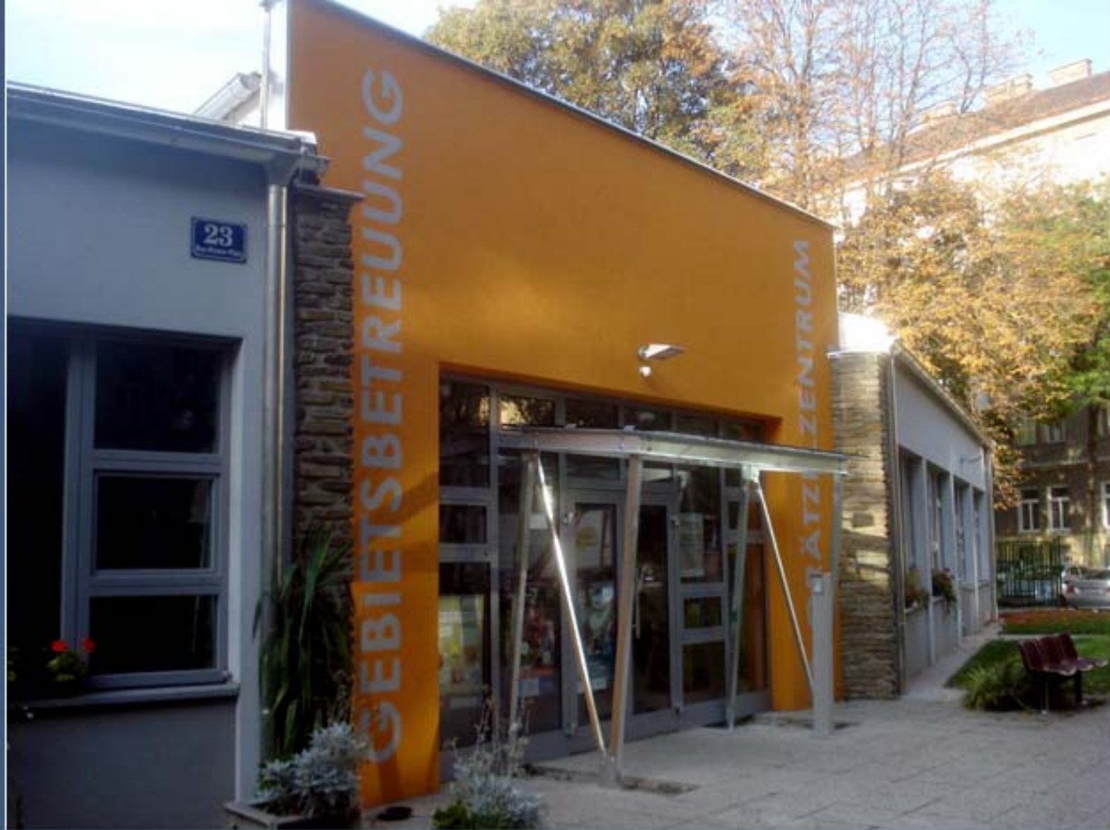
Eingangsbereich mit Vordach